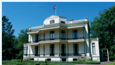
Kasteel De Vanenburg - NZA-cademy